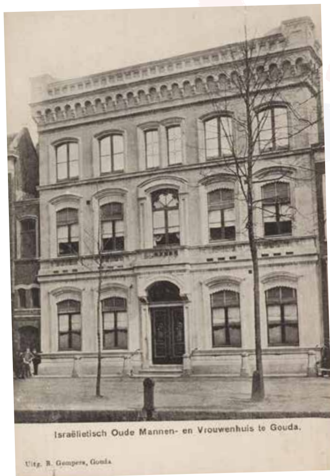
Israëlitisch Oude Mannen- en Vrouwenhuis te Gouda.

Naast het kerkbestuur en de kerkenraad, die zich tevens met de armenzorg bezighielden, waren in Gouda een begrafenissenootschap, een Talmoed-stu-